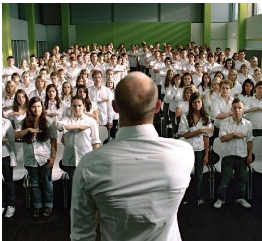
Figura 3 - Professor com os alunos em saudação nacionalista - Cena do filme A Onda

No início cada aluno precisaria pedir permissão para falar, e ficar de pé quando falar. A questão da disciplina é muito importante. Logo depois vem a parte da perda da individualidade, com todos vestindo o mesmo uniforme e andando em blocos. Neste momento a base (estrutura) da experiência já foi posta em ação.