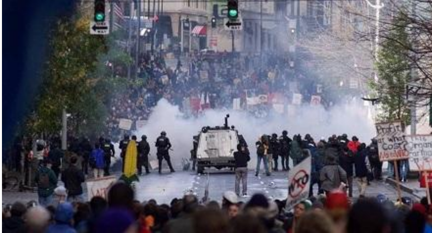
Figura 2 - Globalização é tema recorrente no ENEM e em vestibulares

Os protestos de Seattle podem ser considerados os primeiros organizados através da internet. Estava sendo inaugurada uma nova era, tão recorrente nas manifestações futuras.