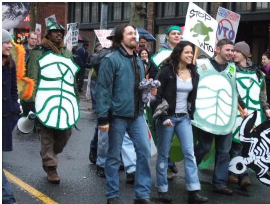
Figura 1 - Cena de A Batalha de Seattle

Ou seja, os protestos de Seattle visavam questionar as mazelas de um mundo globalizado focado no crescimento econômico, muitas vezes deixando questões ambientais, sociais e de direitos humanos em segundo plano.